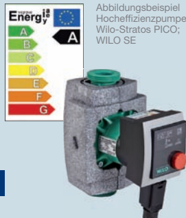
Abbildungsbeispiel Hocheffizienzpumpe Wilo-Stratos PICO; WILO SE